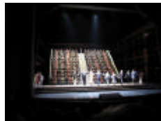
Die Meistersinger von Nürnberg