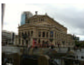
Den gl. Opera i Frankfurt