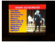
En af foredragets plancher