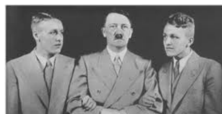
Wieland Wagner Adolf Hitler Wolfgang Wagner